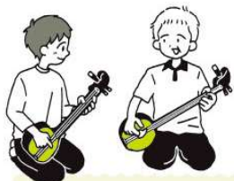
もっと沖縄を知りたくなったら、 芸能や工芸などの文化体験もおすすめ!